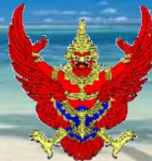
the national emblem of Thailand