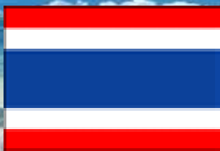
The flag of Thailand